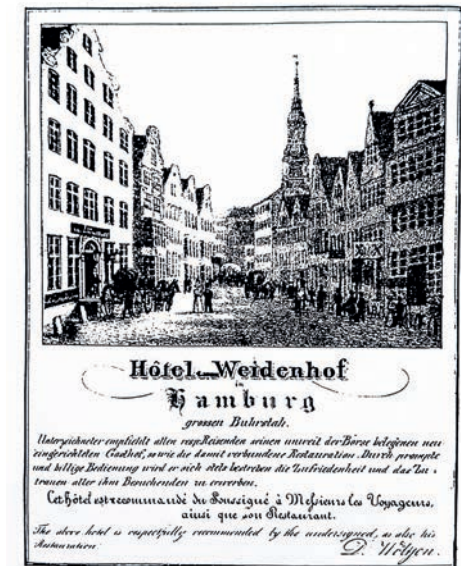
Die Abbildung aus dem Jahre 1830 zeigt im Bild links das „Hotel zum Weidenhof“ am Großen Burstah in Hamburg, in dem am 26. März 1826 die Gründungsversammlung der HEK stattfand.

„Blaue Grotte“ Capri wird wiederentdeckt