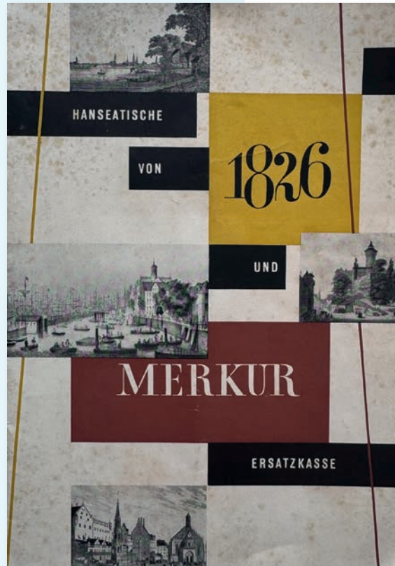
Die HEK fusioniert mit der Merkur Ersatzkasse Nürnberg

Erste elektronische Rechenmaschinen (Vorläufer des Computers)