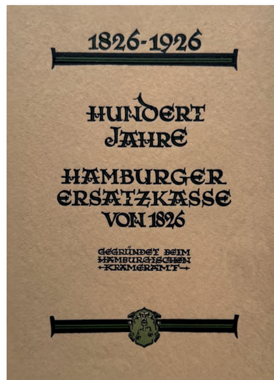
HEK-Broschüre zum 100-jährigen Jubiläum