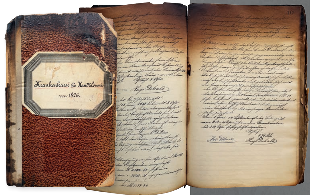
Das Original HEK-Kassenbuch von 1826 konnte vor den Flammen gerettet werden

Es folgen schwere Jahre mit extrem kalten Wintern, in denen ganze Parks und Alleen abgeholzt werden. Die Ernährungssituation ist katastrophal. Kurz nach der Währungsreform geht es jedoch bald wieder aufwärts. Dadurch wird das Geschäftsgebiet über Hamburg hinaus ausgedehnt.