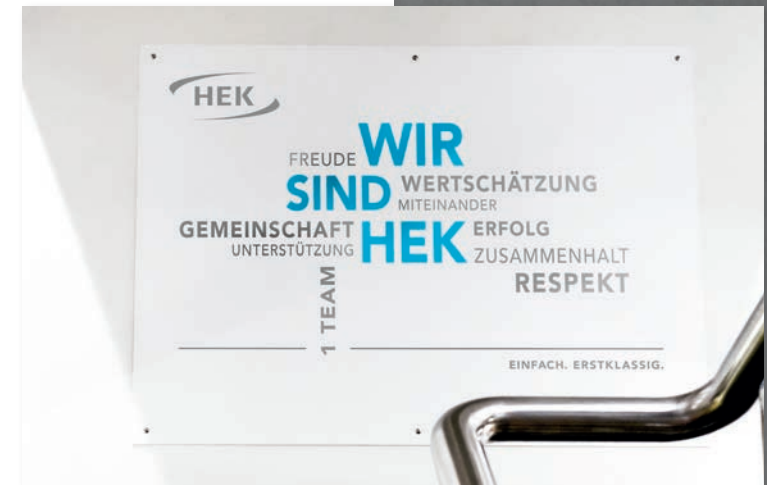
HEK wird 2020 „einfach.erstklassig“.

Gleichzeitig stehen die sozialen Sicherungssysteme unter erheblichem Finanzierungsdruck und Kranken- und Pflegekassen warten auf Strukturreformen der Politik, die eine nachhaltige Finanzierung und zugleich den Erhalt des bisherigen Leistungsniveaus für das nächste Jahrzehnt sicherstellen.