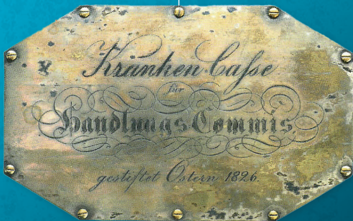
Siegel der damaligen HEK-Truhe