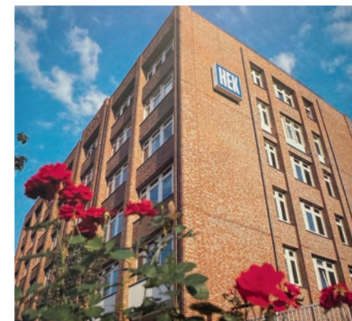
1985: Die HEK zieht in die Wandsbeker Zollstraße