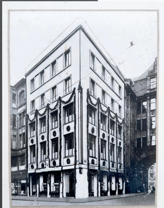
Das Gebäude der Hauptverwaltung in Hamburg Vollständig ausgebrannt im Juli 1943.

Schutzimpfung gegen Wundstarrkrampf (Tetanus) entwickelt (Gaston Ramon)