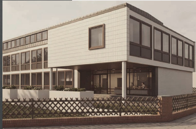
HEK-Gebäude von 1966 bis 1985

Mit der Unterzeichnung des Grundgesetzes am 23. Mai 1949 wird die Bundesrepublik Deutschland konstituiert