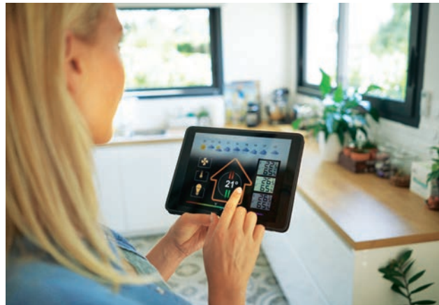
BESTENS VERNETZT: Apps für smartes Wohnen sind im Kommen