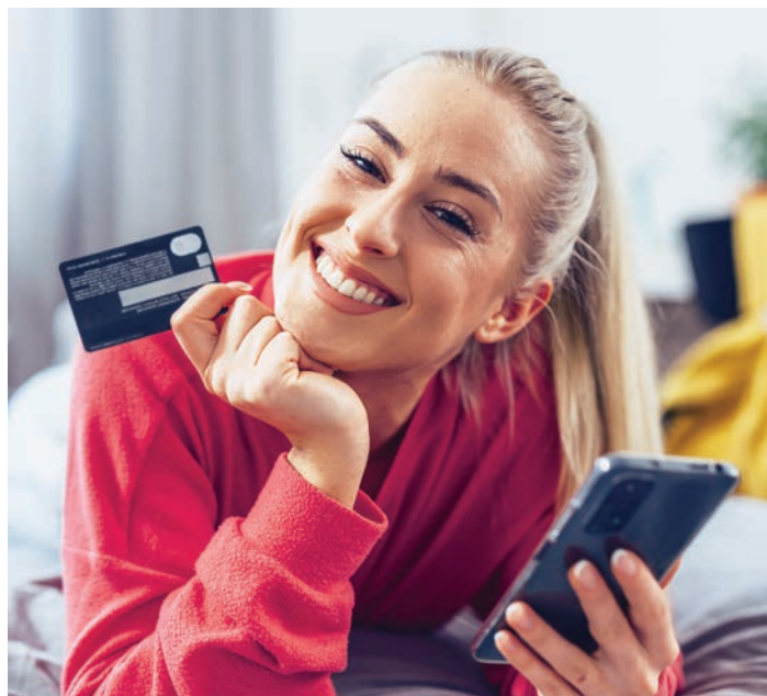
VERSAND ANGEKÜNDIGT: Beim Online-Shopping ist die Angebotsvielfalt unschlagbar