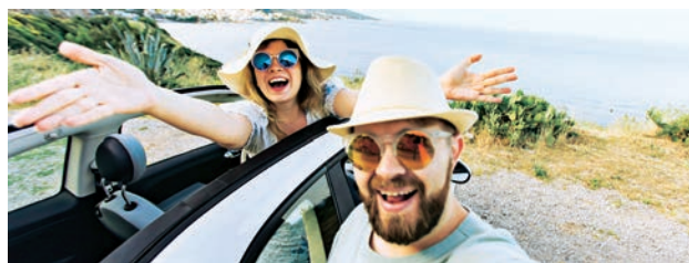
SCHÖNE ERLEBNISSE: via App in Eigenregie geplant und gebucht

Anreise und Unterkunft buchen sowie das Wetter vor Ort checken: Mit den richtigen Apps haben Urlauber gleich ein ganzes Reisebüro in der Tasche. Besonders in der Kategorie Wetter gibt es, wie zum Beispiel bei WetterOnline mit RegenRadar (2,30), sehr gute Bewertungen.